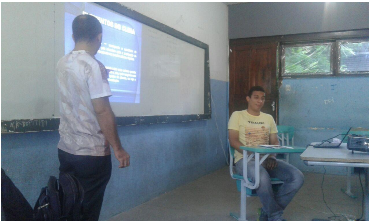
Foto 3: Ministração sobre os tipos de clima e fatores climáticos.