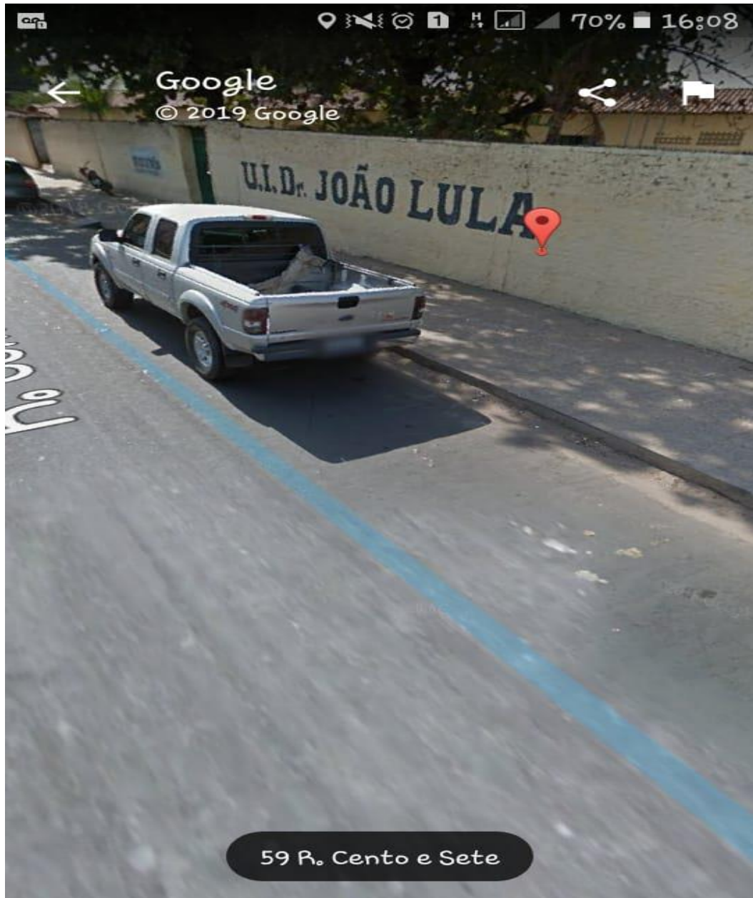
Imagem 2: Fachada da Unidade Integrada Doutor João Lula.