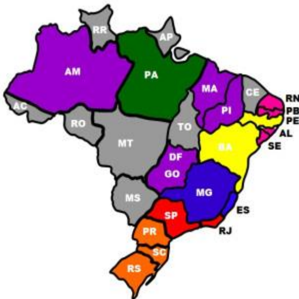
REGIÕES DE MANIFESTAÇÕES CULTURAIS NO BRASIL