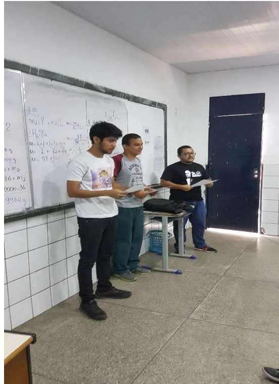
Figura 1: Momento inicial de explicação da atividade.

Então conforme a imagem a seguir, foi visto os momentos onde foram elucidadas as dúvidas e as primeiras orientações sobre o que seria o exercício proposto.