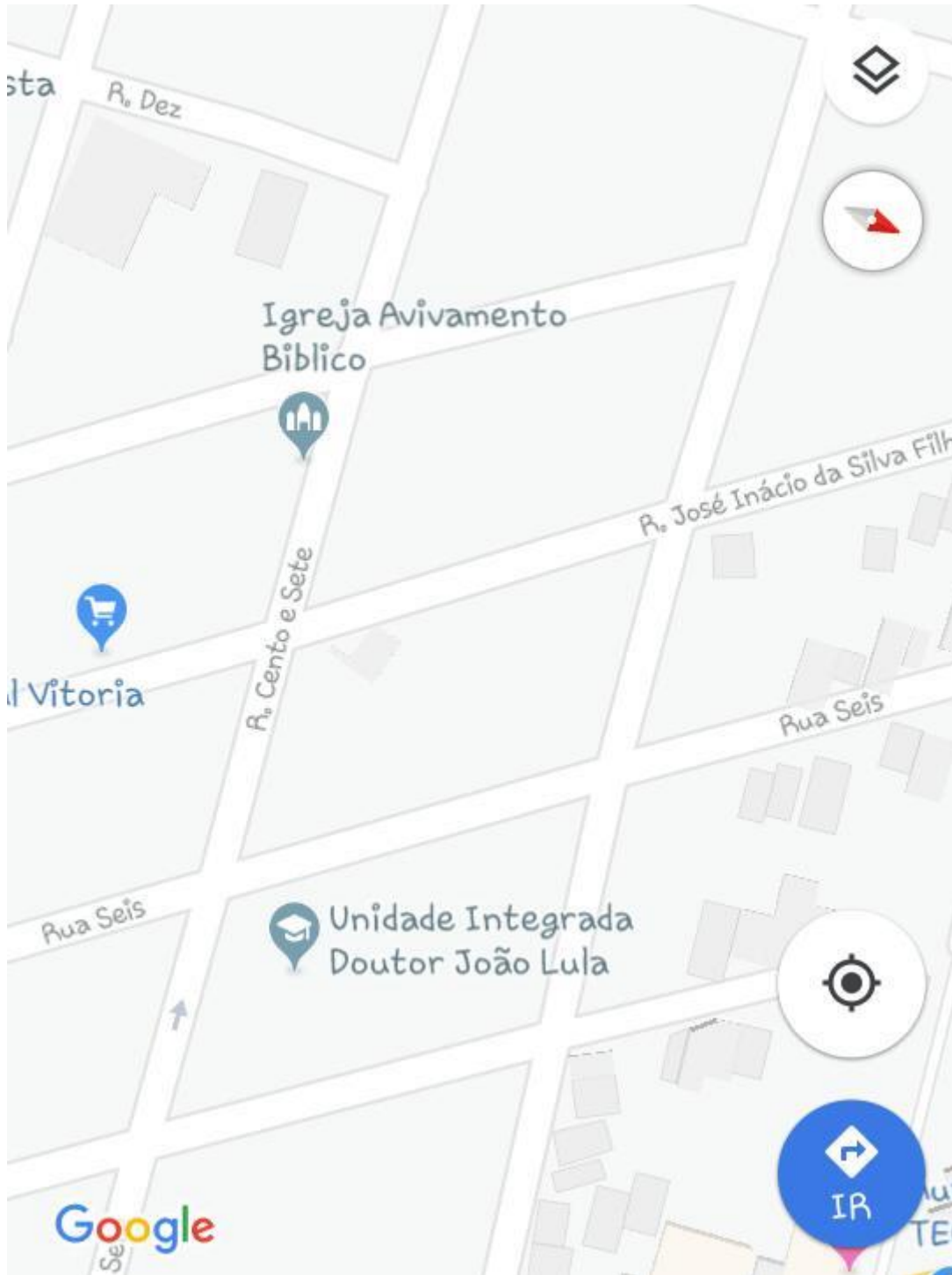
Imagem 1: Localização da Unidade Integrada Doutor João Lula.