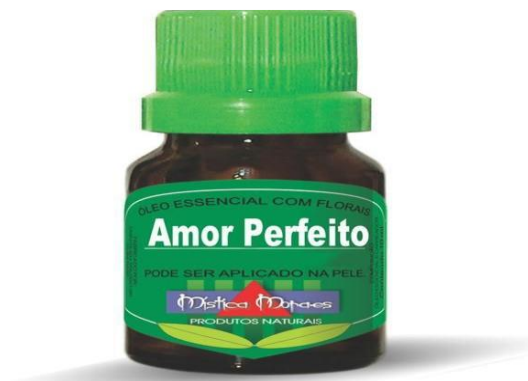
Figura 2 – Óleo essencial de Amor Perfeito.