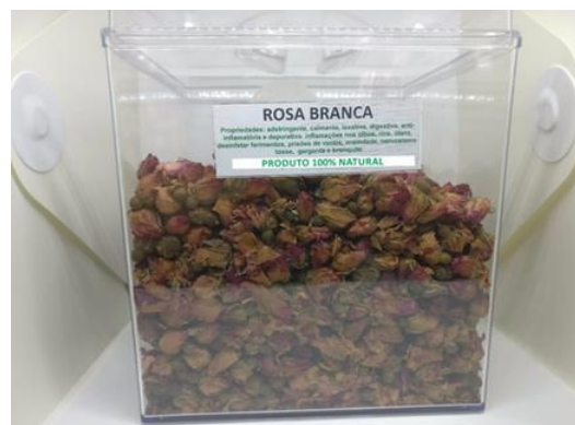
Figura 6 – Flor ressecada de Rosa Branca.