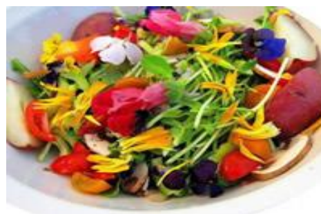
Figura 23 – Althaea officinalis usada em saladas.

https://universodasflores.wordpress.com/2013/12/19/a-planta-marshmallow/