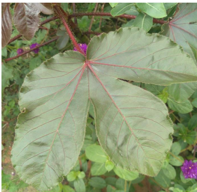
Figura 25 - Pinhão roxo ( Jatropha curcas L.).