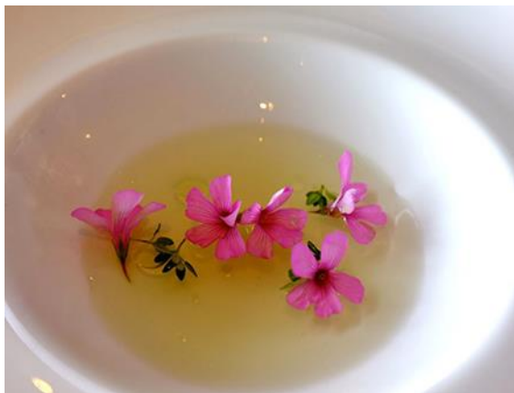
figura 7 – Chá de Gerânio.

Gerânio. Flor rica em propriedades adstringentes, antissépticas e cicatrizantes. É recomendado para tratamentos de pele, o que incluem o combate à celulite e estrias.