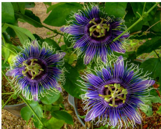
Figura 49 – Maracujá BRS Céu do Cerrado.