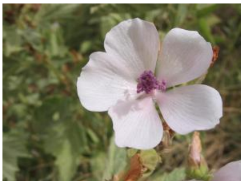
Figura 22 – Althaea officinalis .

Muitas flores são consumidas, sem o consumidor se dar conta, como por exemplo o brócolis, couve-flor, alcachofra, flor e abóbora e outras menos comuns como capuchinhos, rosas, calêndulas, crisântemos, tulipas e dentre outras, no entanto, as flores utilizadas na alimentação não são as mesmas comercializadas em floricultura, pois estas são cultivadas com produtos químicos que podem causar sérios problemas para a saúde, como por exemplo o DDT (diclorodifeniltricloroetano) pesticida que pode atuar sobre o sistema nervoso central e causar alterações comportamentais e distúrbios sensoriais, uma vez que, essas flores são cultivadas para uso ornamental e não nutricional.