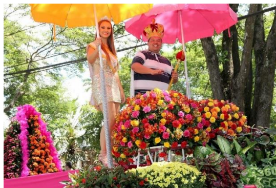
Figura 35 – Carro alegórico para o Canaflores em Holambra-SP