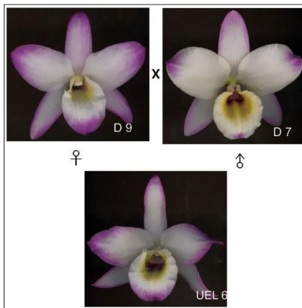
Figura 1. Flores dos genótipos parentais e da cultivar UEL 6 (D9 x D7) (flowers from the parents and from cultivar UEL 6 (D9 x D7). Londrina, UEL, 2006.