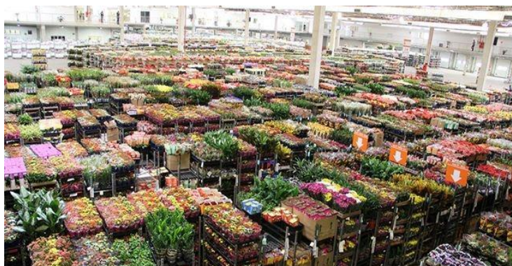
Figura 43 – Fotos do galpão de flores da Cooperativa Veiling Holambra.