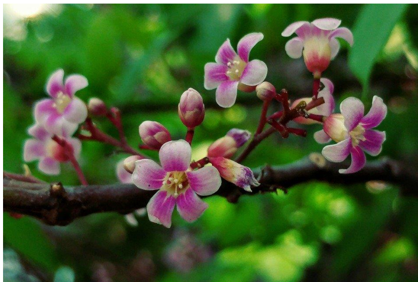
Figura 29 – Carambola ( Averrhoa carambola ).