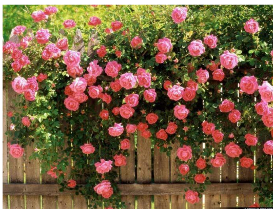
Figura 36 – Rosas ( Rosaceae ) ornamentais, flor de corte, mas que está decorando uma cerca.