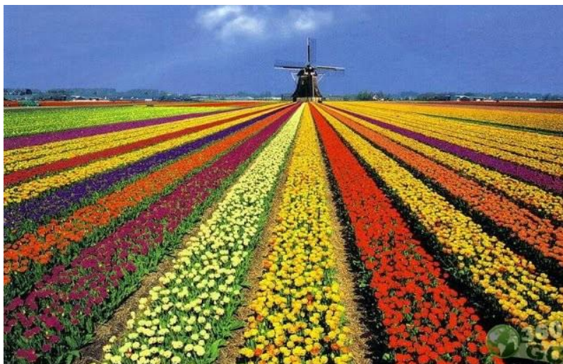
Figura 33 – Campo de flores em Holambra-SP.