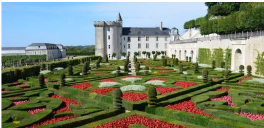
Figura 40 – Jardins franceses.