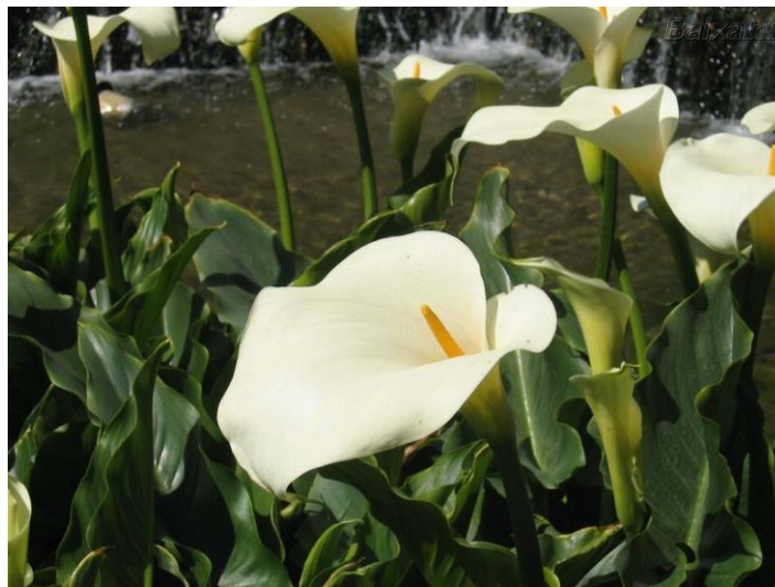
Figura 24 – Copo de leite ( Zantedeschia aethiopica spreng ).