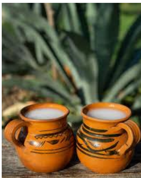
Figura 28 – Pulque.