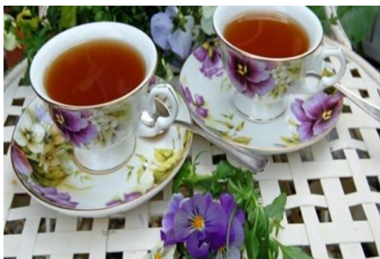
Figura 1 – Chá de Amor Perfeito.