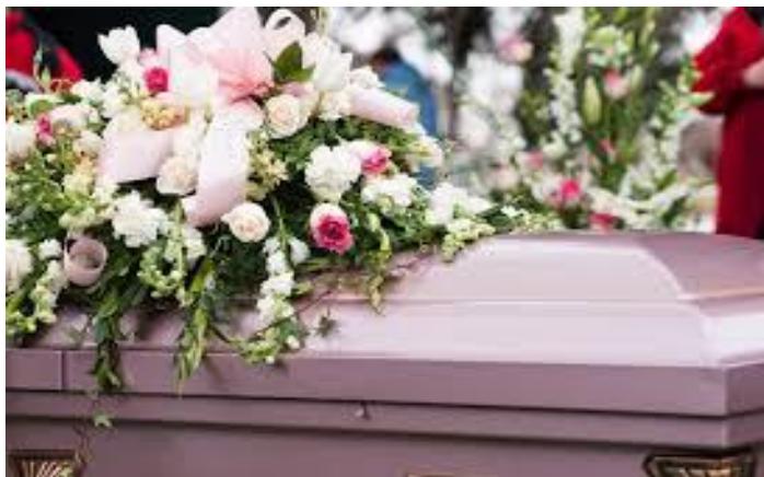
Figura 41 – Flores são comumente usadas em funerais.