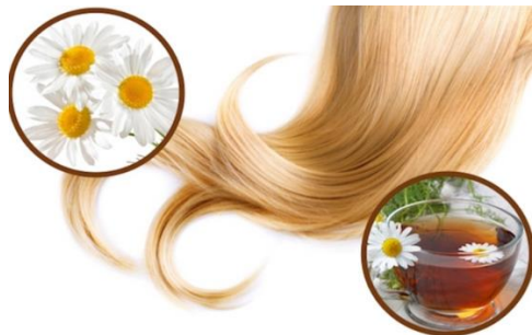
Figura 19 – camomila clareia o cabelo.

Em alguns casos é possível obter benefícios mesmo em preparações caseiras. As flores da lavanda, alecrim e camomila são boas para a pele e o cabelo. Talvez a mais clássica seja mesmo a infusão de flor de camomila: “O chá de camomila pode ser aplicado nos cabelos e, com a exposição ao sol, deixa os fios levemente mais claros”, conta a cosmetóloga e esteticista Edy Guimarães.