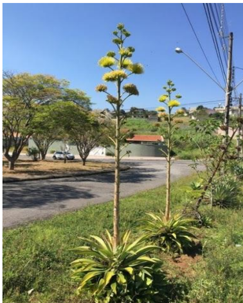
Figura 27 – Agave americana .