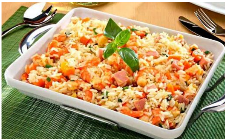
Figura 31 – Calêndula na culinária.