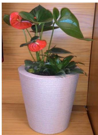
Figura 38 – Antúrio ( Anthurium ), planta ornamental de vaso.