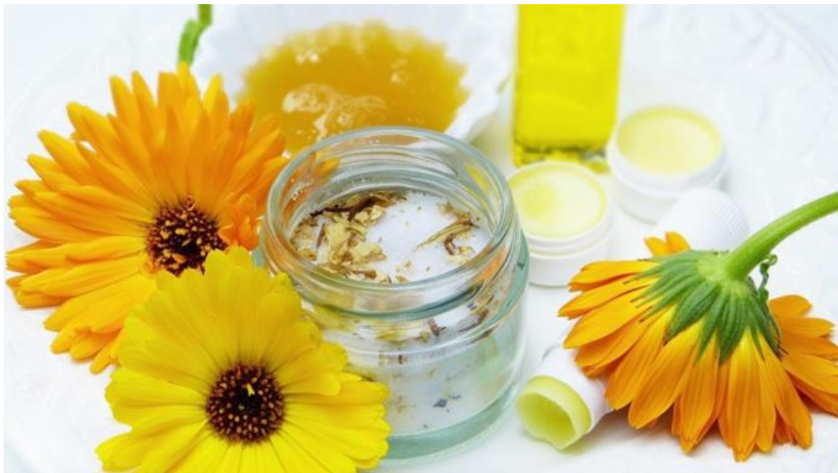
Figura 14 – Creme à base de flores.