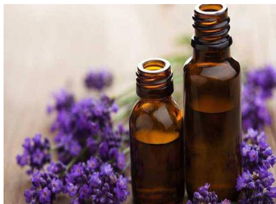
Figura 12 – Óleo essencial de Lavanda.

https://s2.glbimg.com/whKL1zRj_Zp1YwAwxxQtld3q_o=/620x455/e.glbimg.com/og/ed/f/original/2018/10/22/cha-de-lavanda.jpg