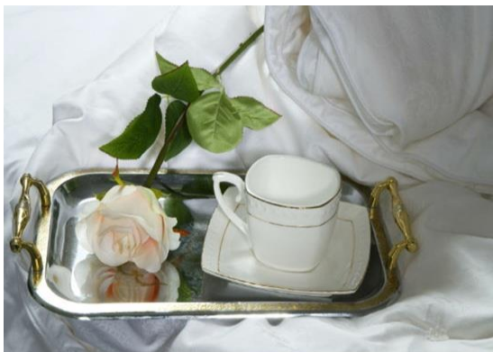
Figura 5 – Chá de Rosa Branca.