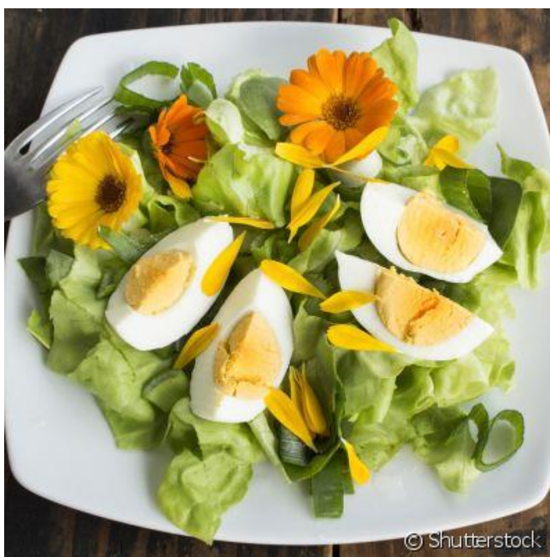
Figura 32 – Calêndula na culinária.