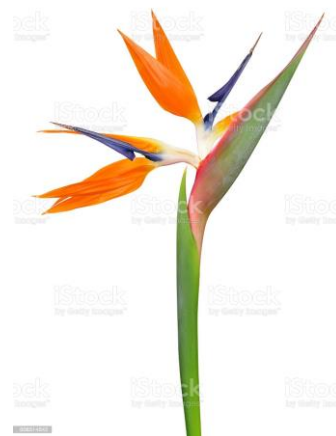
Figura 39 – Flor de estrelíza ( Strelitzia reginae ), planta ornamental tropical.

https://br.pinterest.com/pin/615374736556726515/