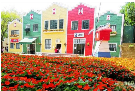
Figura 34 – Rua onde ocorre a ExpoFlora, em Holambra-SP.