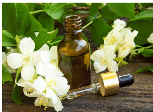
Figura 4 – Óleo essencial de Jasmim.