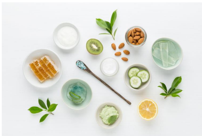
Figura 18 – imagem exemplo de plantas cosméticos veganos.