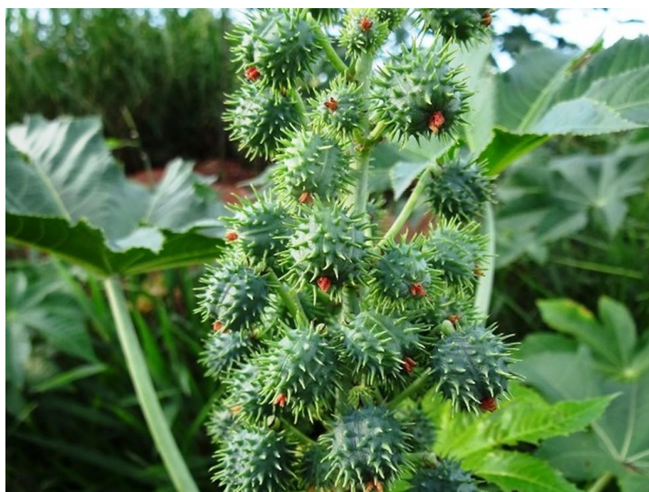
Figura 26 – Mamona ( Ricinus communis ).