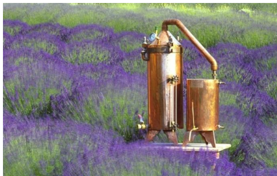
Figura 16 – Extração do óleo essencial da lavanda.