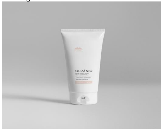
figura 8 – Creme facial de Gerânio.

https://coastlinesurfsystem.com/images/poleznie_svojstva_gerani_i_ee_primenenie_v_bitu_10.jpg