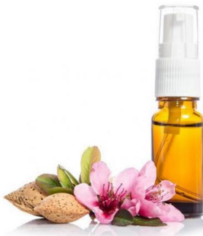
Figura 15 – Óleo essencial.