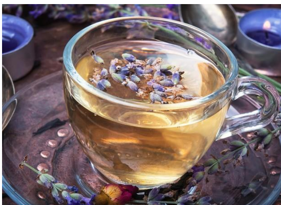
Figura 11 – Chá de Lavanda.

Lavanda (alfazema). Possui ação antifúngica e bactericida, por isso são comuns em produtos de limpeza. Mas ela também possui princípios ativos que contribuem para manter a saúde corporal e possui propriedades cicatrizantes, analgésicas e sedativas, responsáveis pela sua indicação ao combate do estresse, ansiedade e até dificuldades para dormir.