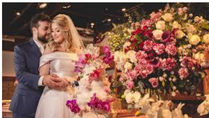
Figura 42 – Flores são usadas como decoração em casamentos.