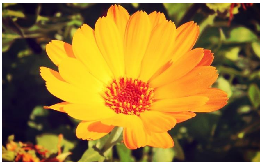
Figura 30 – Calêndula ( Calendula officinalis ).