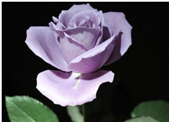
Figura 50 – Rosa geneticamente modificada para ter coloração azul.