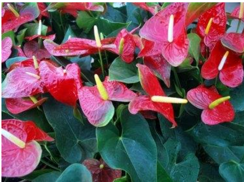
45 – Antúrios desenvolvidos pelo IAC.