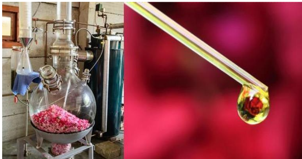
Figura 17 – extração do óleo de rosas.