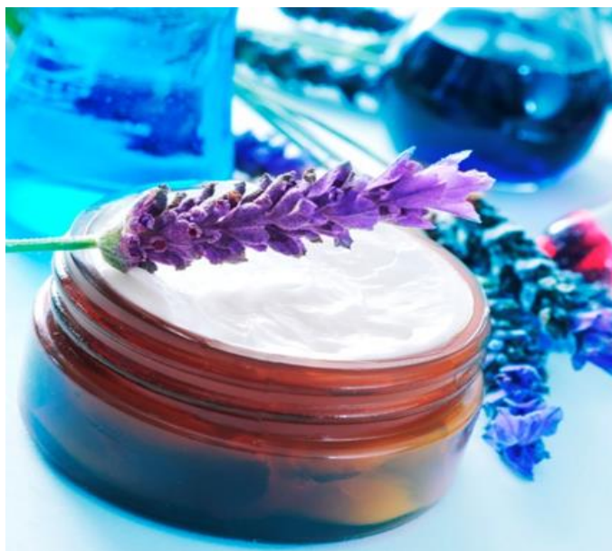
Figura 13 – Exemplo de creme à base de lavanda.

Segundo a ANVISA 2004, a definição conferida pela legislação vigente, Cosméticos, Produtos de Higiene e Perfumes “são preparações constituídas por substâncias naturais ou sintéticas, de uso externo nas diversas partes do corpo humano, pele, sistema capilar, unhas, lábios, órgãos genitais externos, dentes e membranas mucosas da cavidade oral, com o objetivo exclusivo ou principal de limpá-los, perfumá-los, alterar sua aparência e ou corrigir odores corporais e ou protegê-los ou mantê-los em bom estado”. Os óleos essenciais no campo da cosmética servem para perfumar produtos como xampus, sabonetes, cremes entre outros.