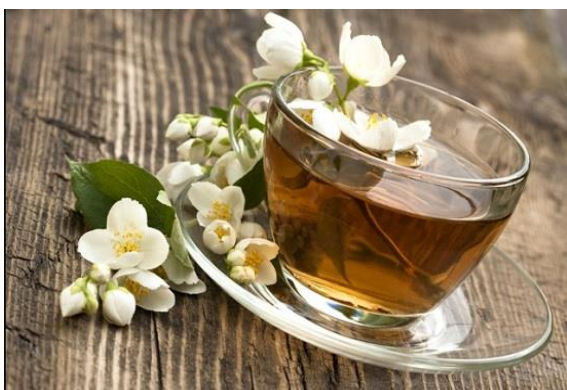
Figura 3 – Chá de Jasmim.