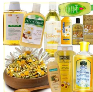
Figura 20 – Produtos com base a camomila.

https://static.tuasaude.com/media/article/cc/z6/camomila-clareia-o-cabelo_15074_1.jpg