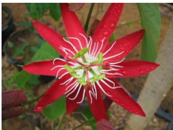
Figura 47 – Maracujá BRS Rubiflora.