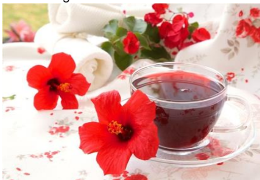
Figura 9 – Chá de Hibisco.