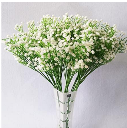
Figura 37 – Gypsophila , um tipo de flor ornamental.