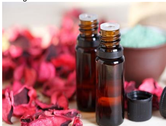
Figura 10 – Óleo essencial de Hibisco.