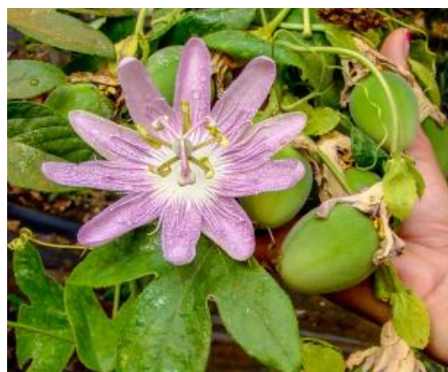
Figura 48 – Maracujá BRS Rosea Púrpura.