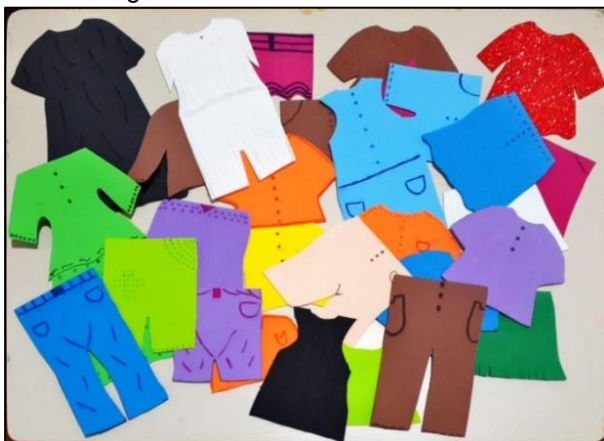
Figura 06 – Modelo de material A

Abaixo serão apresentados os materiais utilizados para aplicação das atividades.