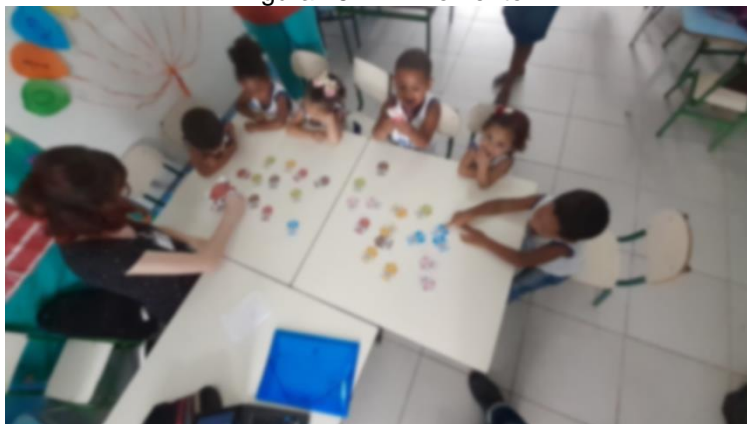
Figura 15 – 4º Momento