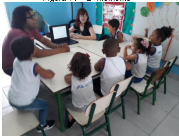
Figura 11 – 2º Momento