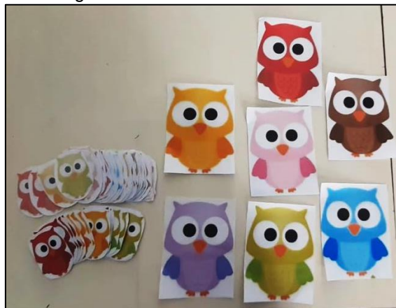
Figura 07 – Modelo de material B