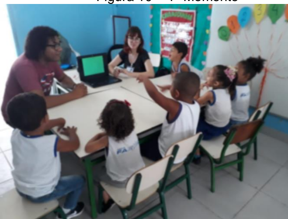
Figura 10 – 1º Momento

Seguindo a ordem cronológica de momentos durante a aplicabilidade da atividade, segue abaixo as imagens das crianças da Turma III – A durante o processo de conhecimento através da atividade proposta por nós. Lembrando que, as imagens expostas foram capturadas por Daiana de Jesus Barcelos Berlarmino, na qual estava presente na sala de aula durante a atividade.