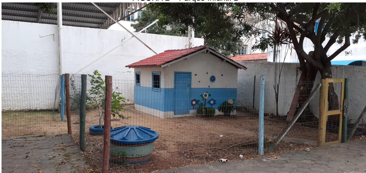
FIGURA 2 – Parque Infantil B

As crianças precisam brincar em pátios , quintais, praças, bosques, jardins , praias, e viver experiências de semear, plantar e colher os frutos da terra, permitindo a construção de uma relação de identidade , reverência e respeito para com a natureza. Elas necessitam também ter acesso a espaços culturais diversificados: inserção em práticas culturais da comunidade, participação em apresentações musicais, teatrais, fotográficas e plásticas, visitas a bibliotecas, brinquedotecas, museus, monumentos, equipamentos públicos, parques, jardins (p. 94, grifo nosso).