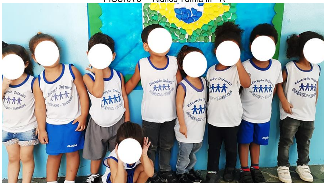
FIGURA 3 – Alunos Turma III - A

Sendo assim, eu aprendo, mudo e me transformo com base nas transformações, nas mudanças e na interação com o outro, e é nesse processo consciente de interação verbal ou dialógica que construímos a nossa identidade e a identidade do outro. Geralmente essa interação é baseada na nossa percepção e a nossa ideia de valor, ideia essa que tem sua origem na infância e nos acompanha pelo resto de nossas vidas.