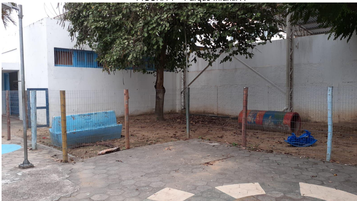
FIGURA 1 – Parque Infantil A

Também é preciso haver a estruturação de espaços que facilitem que as crianças interajam e construam sua cultura de pares, e favoreçam o contato com a diversidade de produtos culturais (livros de literatura, brinquedos, objetos e outros materiais), de manifestações artísticas e com elementos da natureza (2013, p. 91).