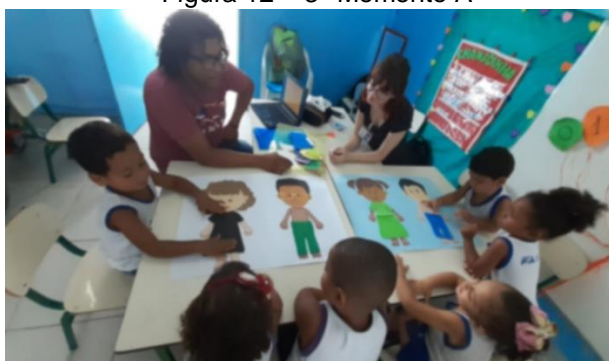
Figura 12 – 3º Momento A