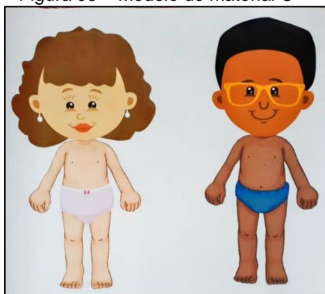
Figura 08 – Modelo de material C