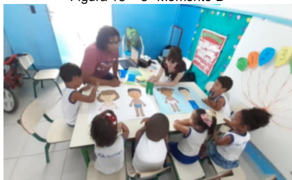
Figura 13 – 3º Momento B