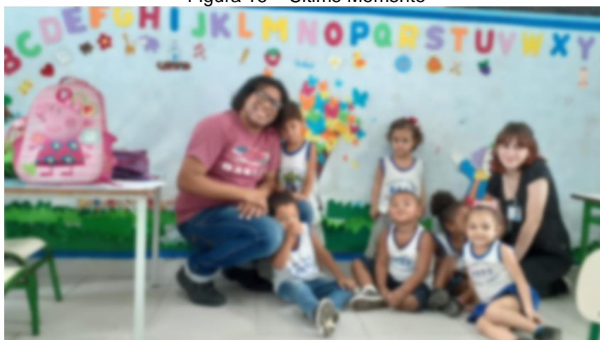
Figura 16 – Ultimo Momento