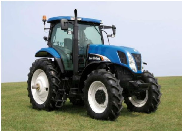
2. New Holland