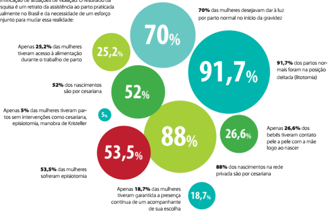
Figura 1. Pesquisa Nascer no Brasil.

A Pesquisa Nascer no Brasil revelou que muitas mulheres não vêm tendo seus direitos respeitados no momento do parto. Muitas até os desconhecem, dificultando a identificação de situações de violação. O resultado da pesquisa é um retrato da assistência ao parto praticada atualmente no Brasil e da necessidade de um esforço conjunto para mudar essa realidade: