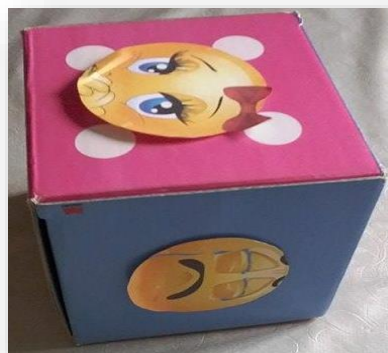
Fig.2- Instrumentos utilizados na segunda dinâmica

Na última dinâmica, realizamos um dado, onde se colocou, em cada face, um “smile” representando assim, uma emoção. As expressões emocionais utilizadas foram: timidez; medo; tristeza; ansiedade; raiva e felicidade. Cada uma das crianças lançava o dado e em seguida diziam qual era a emoção representada e tinham de a descrever.