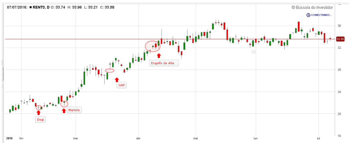
Gráfico 12: Análise de candles RENT3