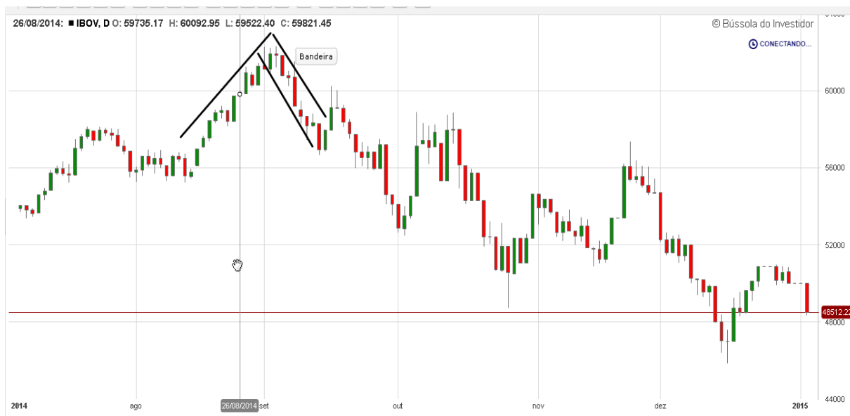
Gráfico 6: Análise de formações gráficas IBOV