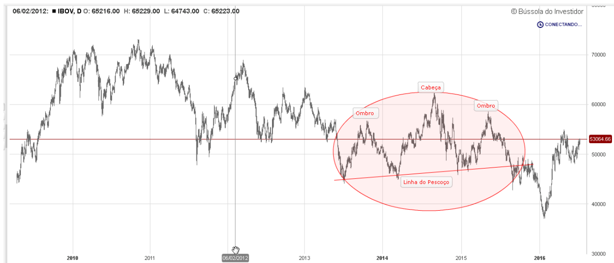
Gráfico 5: Análise de formações gráficas IBOV