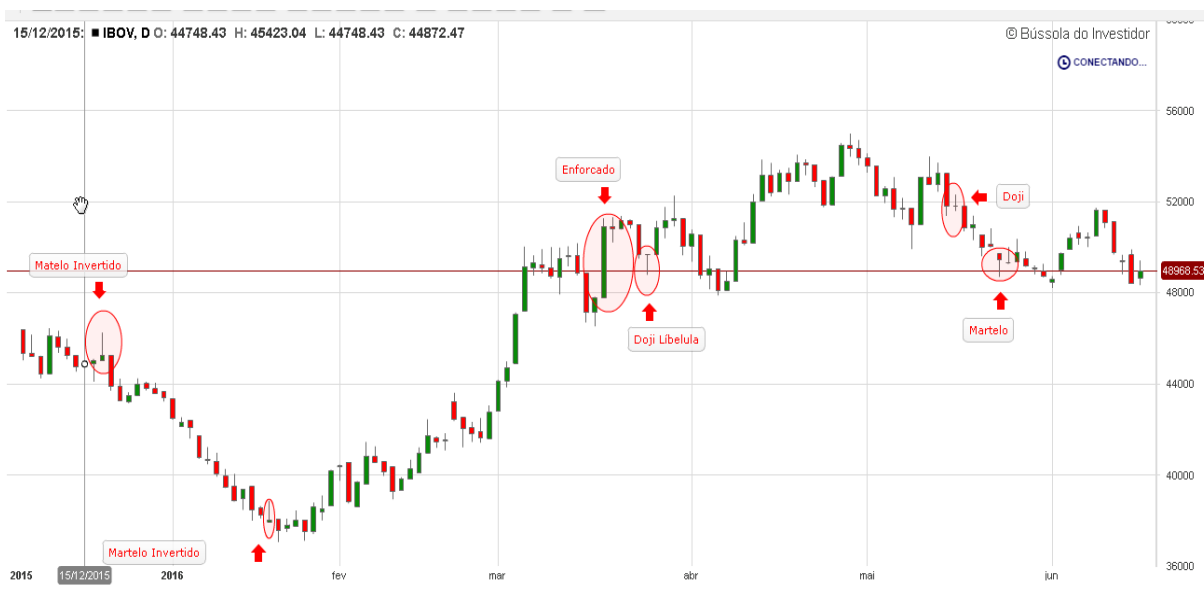
Gráfico 4: Análise de candles IBOV