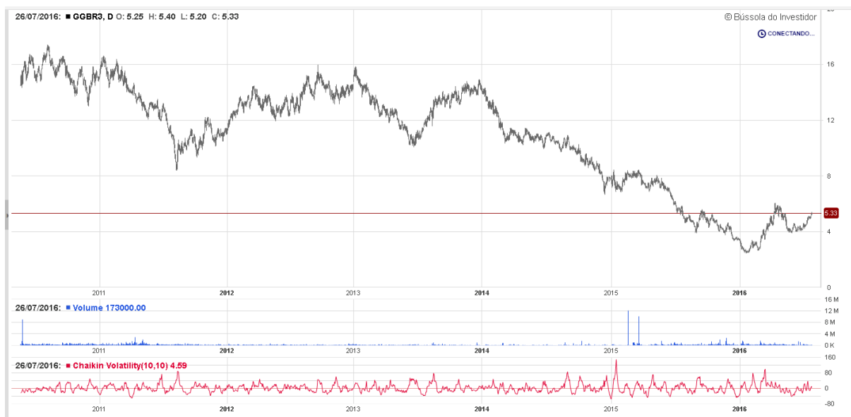
Gráfico 16: Visão geral ação GGBR3 de jul 2010 – jul 2016