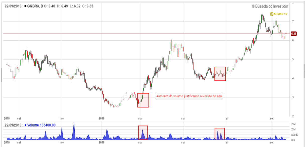
Gráfico 21: Análise do volume GGBR3