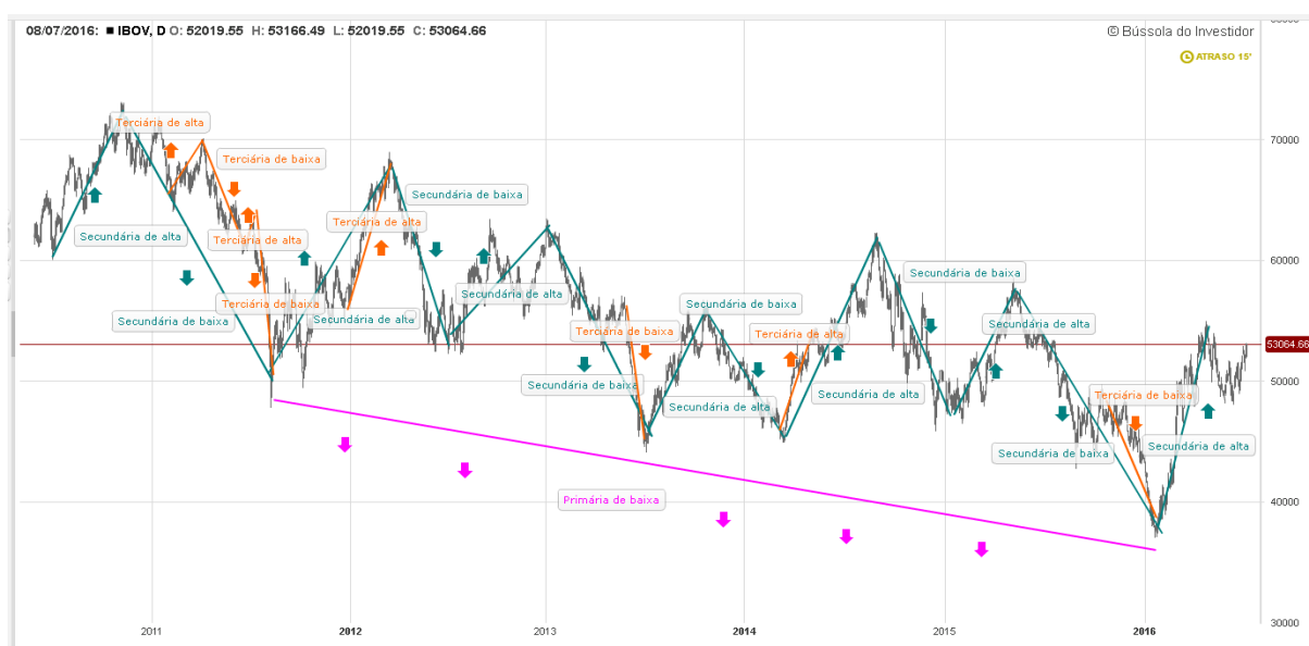
Gráfico 2: Análise de tendências IBOV