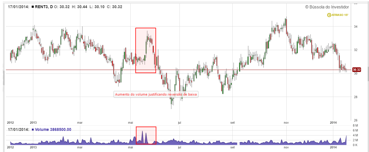
Gráfico 14: Análise do volume RENT3