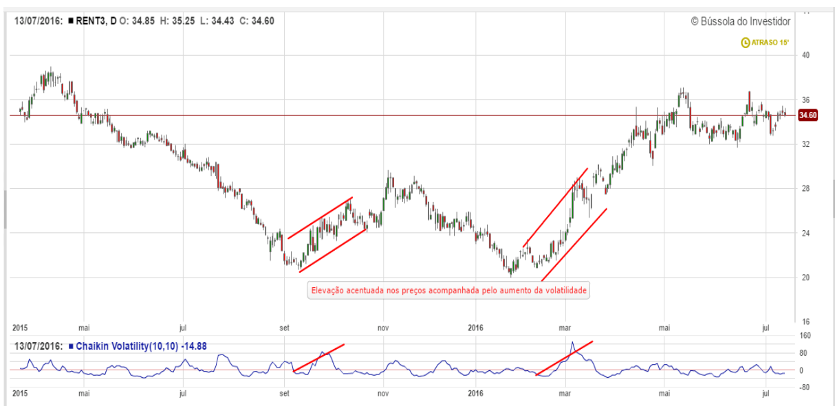
GRÁFICO 22: Análise da volatilidade GGBR3