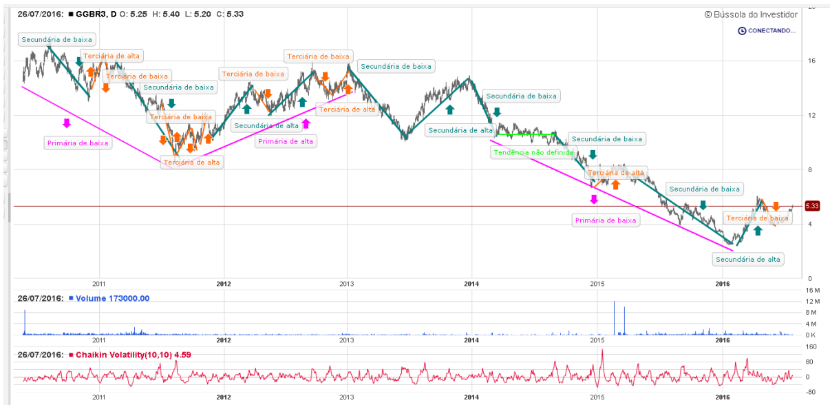
Gráfico 17: Análise de tendências GGBR3