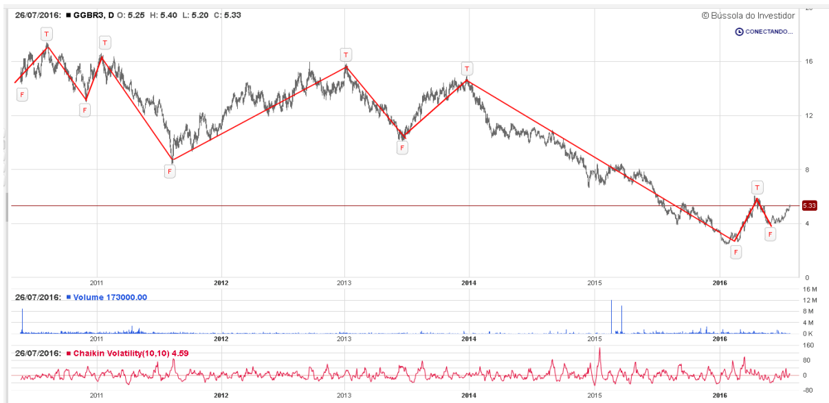
Gráfico 18: Análise de topos e fundos GGBR3