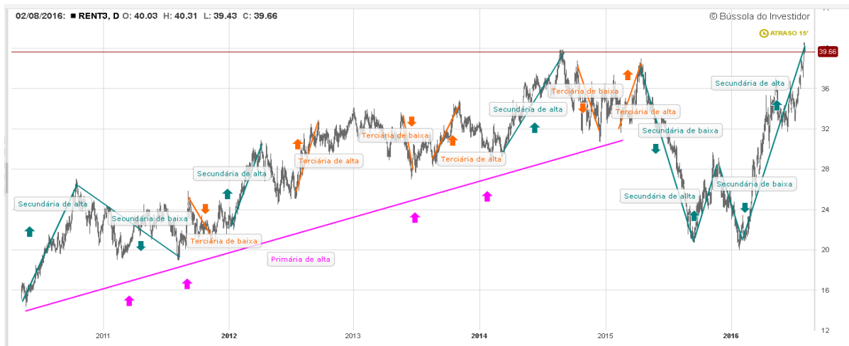
Gráfico 10: Análise de tendências RENT3