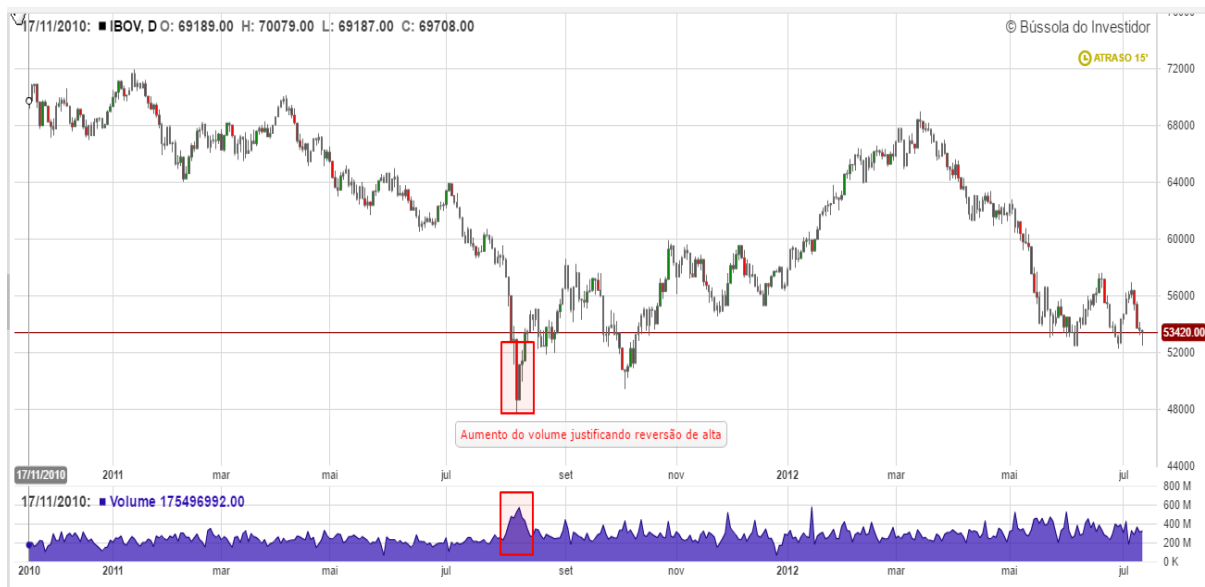
Gráfico 7: Análise do volume IBOV