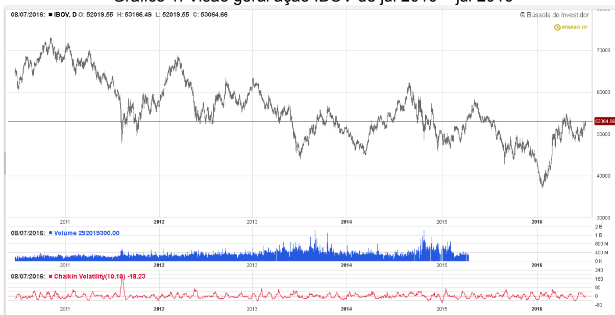
Gráfico 1: Visão geral ação IBOV de jul 2010 – jul 2016