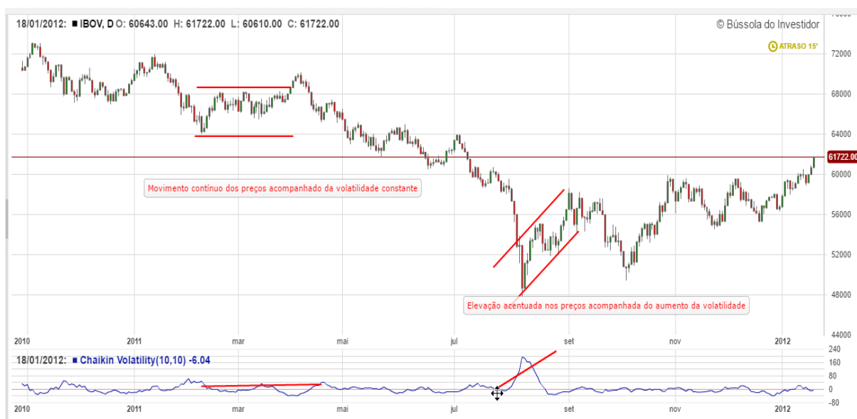
Gráfico 8: Análise da volatilidade IBOV