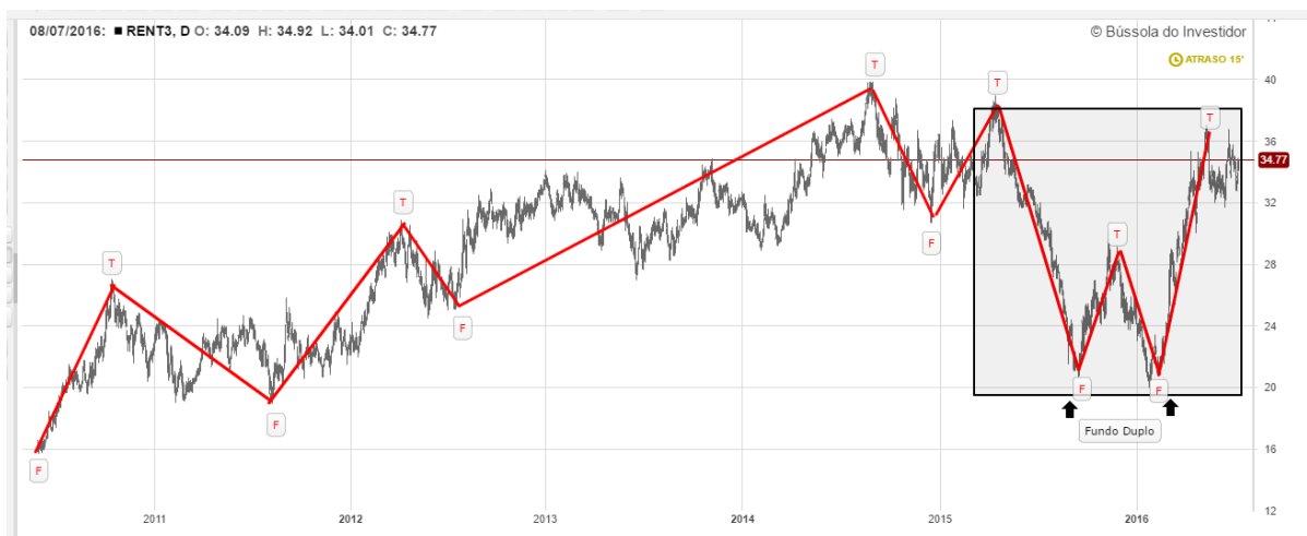
Gráfico 11: Análise de topos e fundos RENT3