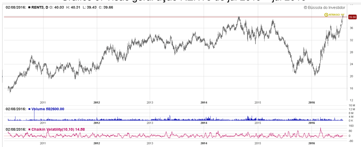
Gráfico 9: Visão geral ação RENT3 de jul 2010 – jul 2016