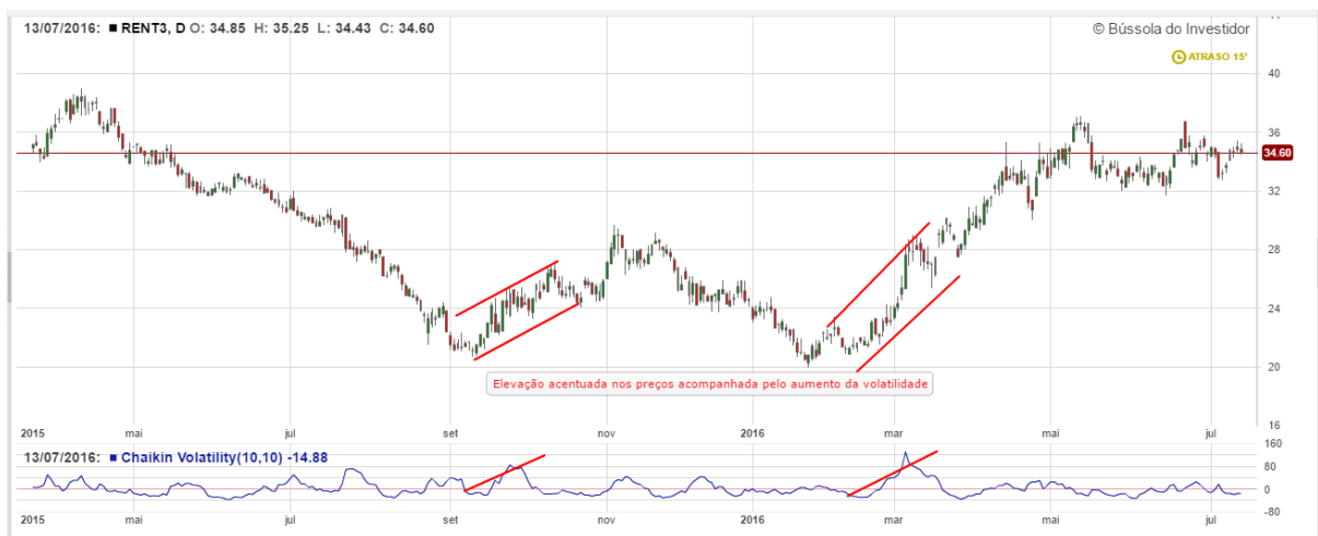
Gráfico 15: Análise da volatilidade RENT3