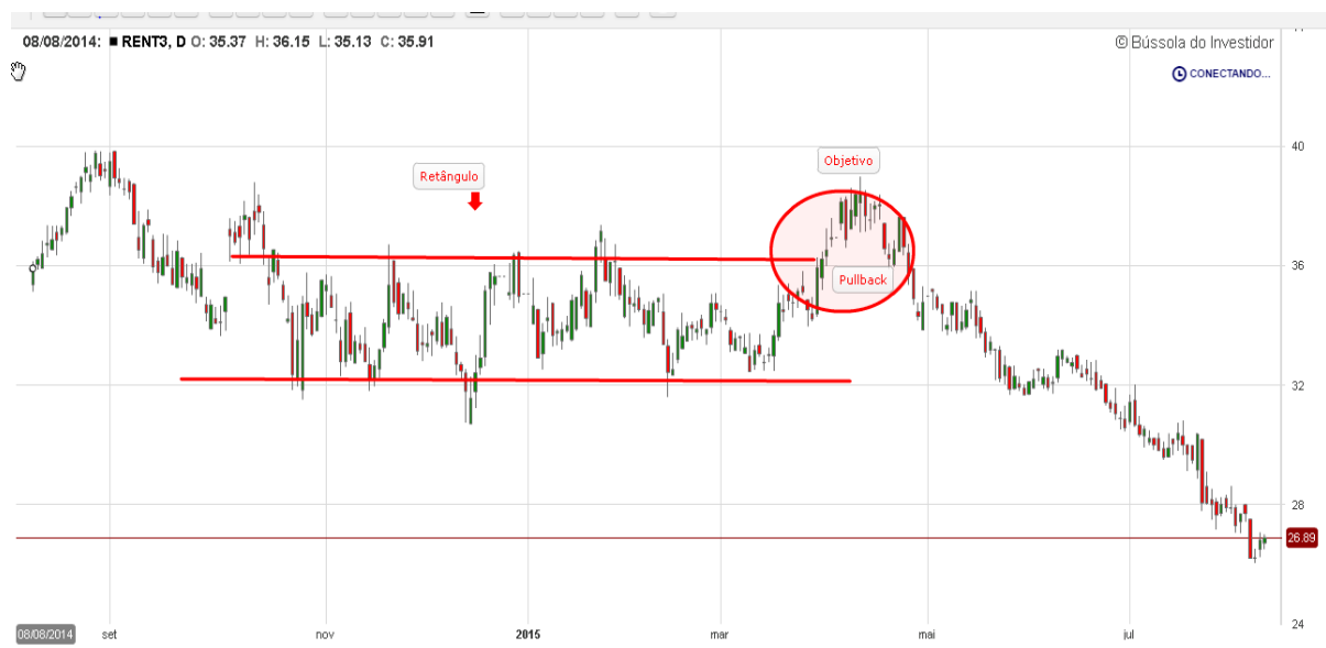
Gráfico 13: Análise de formações gráficas RENT3