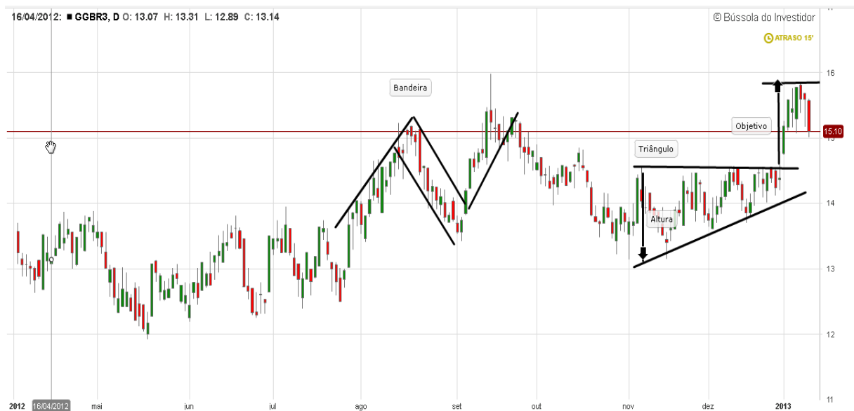
Gráfico 20: Análise de formações gráficas GGBR3