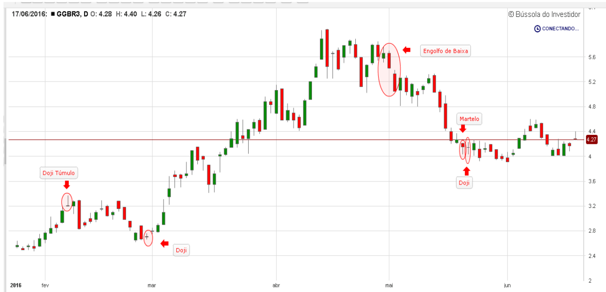
Gráfico 19: Análise de candles GGBR3