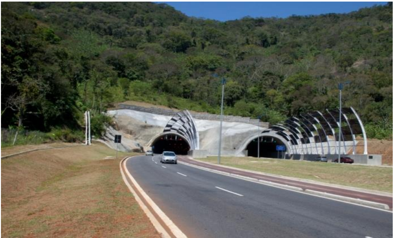
FIGURA 10 – Túnel da Grota Funda: acesso à Ilha de Guaratiba pela esquerda e ao Recreio dos Bandeirantes pela direita ( http://www.rio2016.com ).

As características físicas da cidade, caracterizada por inúmeras elevações, sempre representaram dificuldades impostas pelo meio à expansão urbana do Rio de Janeiro. Nesse sentido, vale repetir, a perfuração de túneis, desde 1887, se configura uma necessidade premente e simboliza a conexão de uma área, anteriormente consagrada à natureza, ao contexto citadino (ABREU, 2008; CARVALHO, 2004).