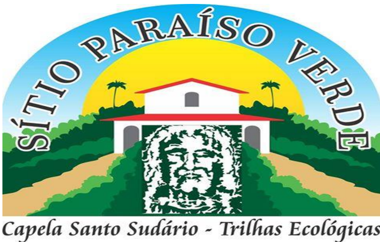
FIGURA 2 – Imagem do folder publicitário do Sítio Paraíso Verde, residência secundária do Doutor José Humberto Rezende, onde encontra-se a Capela do Santo Sudário. Devido a critérios adotados pelo proprietário do sítio, as imagens da capela não podem ser divulgadas, restringindo-se às visitas dos fiéis e pesquisadores.