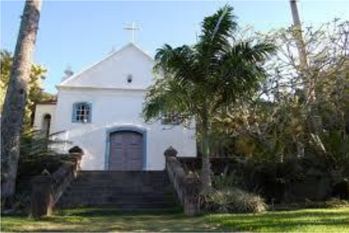
ILUSTRAÇÃO 8 – Igreja Santo Antônio da Bica, erguida em 1690, hoje pertencente ao Sítio Roberto Burle Marx ( http://sitioburlemarx.blogspot.com.br/ ).