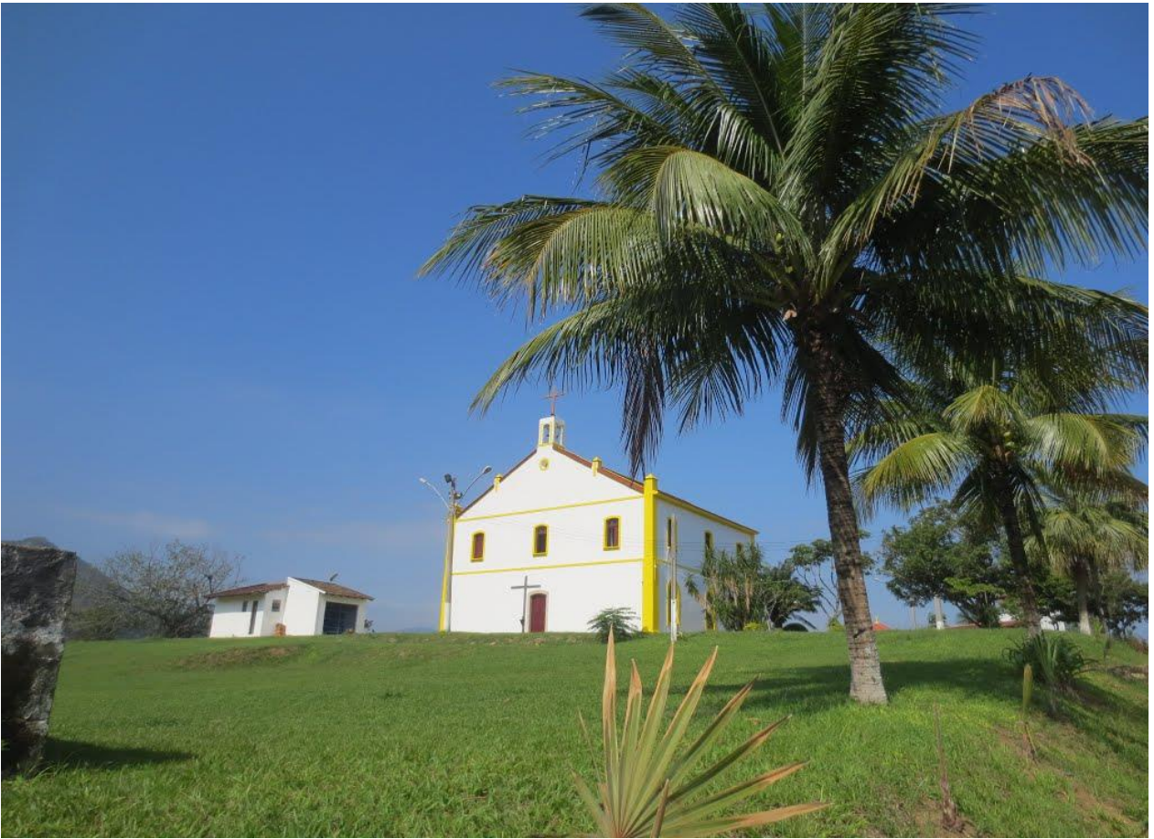
FIGURA 3 – Igreja da Matriz de Guaratiba.

Sobre o fenômeno religioso e sua relação com a geografia, Rosendahl (2002) pontua que, por ser parte integrante da vida do homem, a religião nos ajuda a compreender o sentimento do ser humano em relação a certos lugares simbólicos, como locais de peregrinação e templos. Em outro estudo, a professora Zeny Rosendahl (2003, p 205) afirma que: