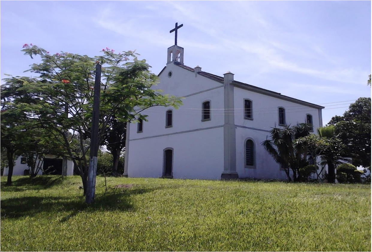
FIGURA 9 – Igreja São Salvador do Mundo: Igreja Matriz de Guaratiba ( http://urbecarioca.blogspot.com ).