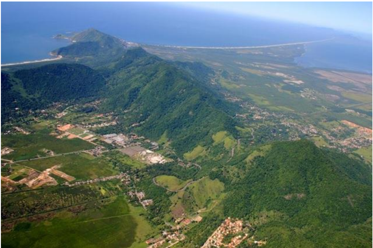
FIGURA 6 – Serra da Grota Funda ou Serra Geral de Guaratiba, elevação pertencente ao “Maciço da Pedra Branca” que separa Ilha de Guaratiba – à oeste – do Recreio dos Bandeirantes (Foto de REDONDO, 2012).

desagrado, uma vez que remetia o lugar a uma condição de atraso em relação aos bairros urbanizados da cidade. Nestes termos, a atmosfera rural e campestre de Ilha de Guaratiba, sobretudo para os jovens, remetia o bairro a um estágio pretérito em descompasso com o restante da cidade. Na tentativa de elucidar os motivos pelos quais um determinado artefato ou lugar acresce ou decresce valor às suas características, Mello (2003) preconiza que um símbolo perde ou recebe tal distinção dependendo da escuridão ou da claridade a ele atribuída no transcurso do tempo. Assim sendo, à medida que a sociedade e a cultura mudam com o tempo, a relação para com o ambiente pode igualmente transformar-se rumando até mesmo para uma verdadeira veneração à natureza (TUAN, 2012).