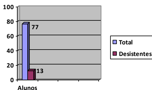
Gráfico 1. Quantidade de alunos matriculados e desistentes

Após entrevistas com alunos e coordenação do pólo, observações nos espaços do Centro de Estudos Superiores, na condição de aluno e ainda a partir da quantificação dos dados obtidos pode se dizer que a desistência foi de 13 alunos, um número que pode ser considerado expressivo, tendo em vista que representa um percentual de 16,88%, dos 77 alunos matriculados inicialmente na especialização Educação do Campo.