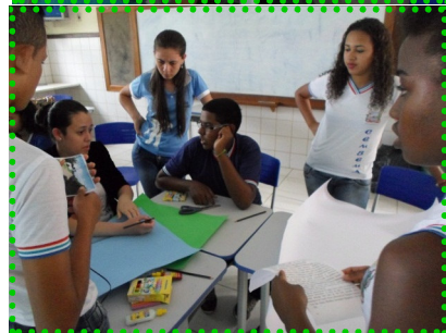
Alunos confeccionando cartaz que mostra os problemas ambientais observados na aula de campo