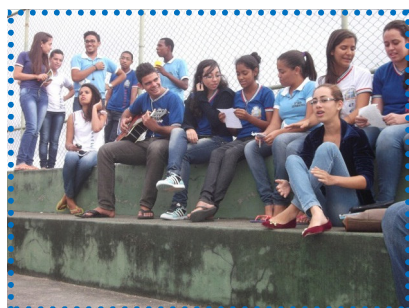
Alunos apresentando as paródias elaboradas sobre o Meio Ambiente