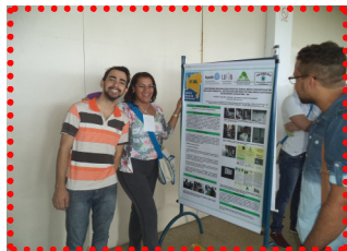
Apresentação durante o IV Simpósio Baiano das Licenciaturas/ Ilhéus-BA, 2014