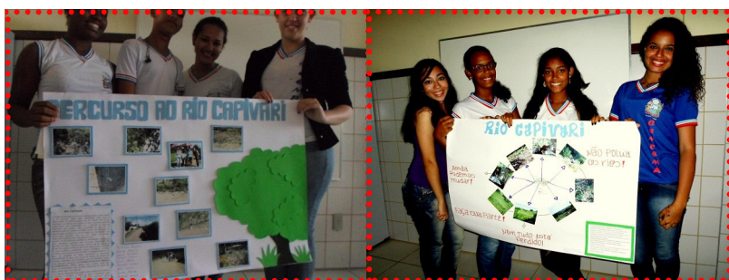
Exposição do Cartaz sobre os problemas ambientais