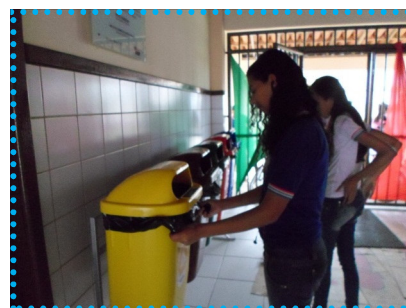
Alunos utilizando as lixeiras da coleta seletiva