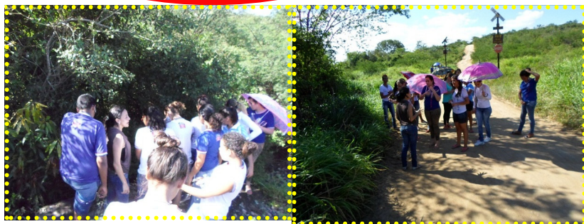
Aula de Campo no Rio Capivari- São José do Itaporã