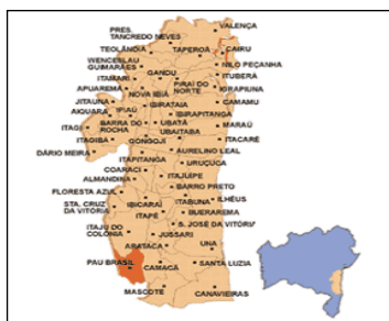
FIG. 1 Município de Pau Brasil

Atualmente, o plano encontra-se em fase de revisão final e encaminhamento para apreciação da câmara para possível aprovação.